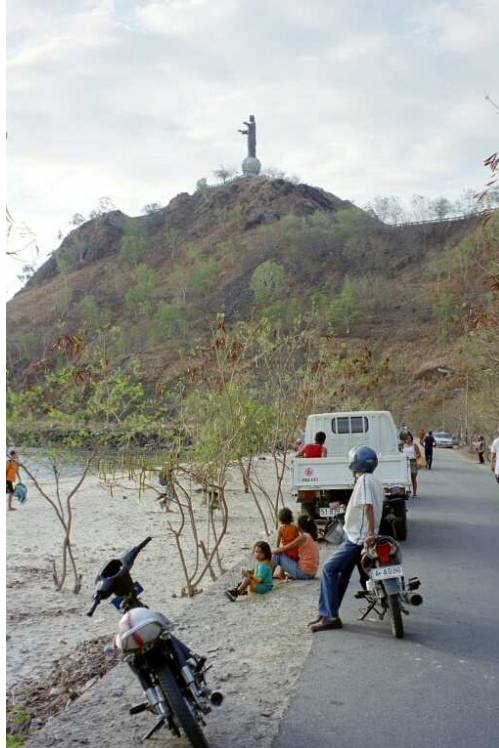
Söndagsflanörer nedanför Kristusstatyn utanför Dili

Saknades gjorde också FN-personalen som fanns överallt vid förra besöket. Men det var varmt och soligt som då. Att åka omkring i Dili gav ingen känsla av bygg-boom direkt. Faktiskt så såg vi inga byggen alls vilket förvånade. Det var med andra ord sig likt vilket