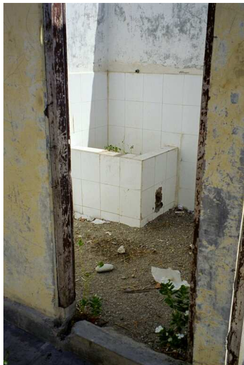
Junior high school i Atabae sedan 1999

Det var minst sagt spännande att få göra ett nytt besök hos våra fackliga kollegor på Östtimor. Vi hade ett nytt Läraryrshuset att besöka och ett vattenprojekt att utveckla. Saken är ju den att vi redan lanserat projektet "Vatten till landsbygdens skolor på Östtimor". Nu var det dags att träffas och gemensamt lägga upp planerna för det fortsatta arbetet. Vi blev verkligen väl mottagna. Hämtade på flygplatsen och körda direkt till Läraryrshuset där