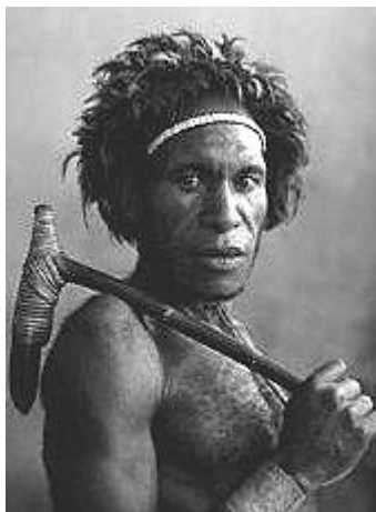
Man från Wamena

I Merauke träffade jag även på några lärare på stan som ville att jag skulle komma och besöka deras skola. Jag gjorde det dagen efter och fick gå runt i klasserna och berätta om min resa mm. Jag gjorde också lärarna glada genom att berätta för barnen hur viktigt det är att de studerar engelska flitigt så de kan prata med folk från nästan