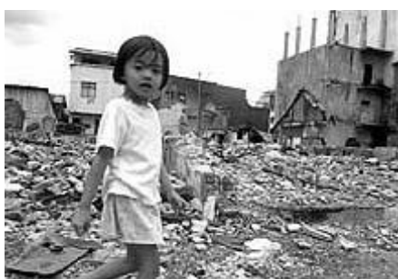
En lite flicka påväg genom ruinerna i stadens centrum

På grund av kriget är staden delad i två delar. Den nor- ra delen kontrolleras av de muslimska Jihad, medan den södra delen hålls av kristna.