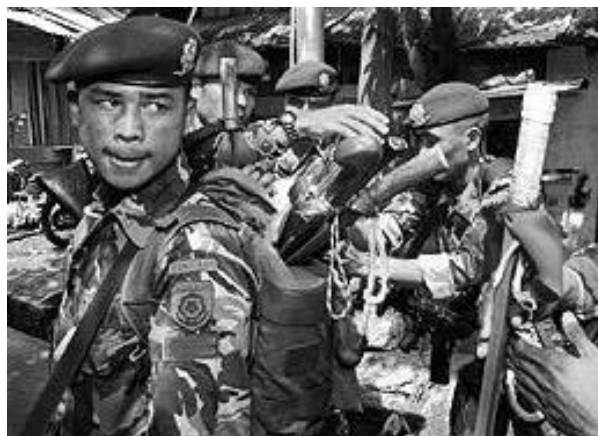
Soldater som just anlänt till Ambon pga oroligheterna

P.g.a. det tidigare uttalandet av några muslimska extrema partier att det inte skulle bli något julfirande, förväntade man hos den kristna befolkning på Ambon en stor offensiv från Laskar Jihadsidan. Den allmänna situationen under december månad var mycket spänd. Folk och de vanliga indonesiska soldaterna på gränsbevakning trodde att offensiven skulle inledas under julen. Ingenting hände, men den 28e december efter avslutningen på den muslimska fastemånaden vid midnatt kl. 00.15 började