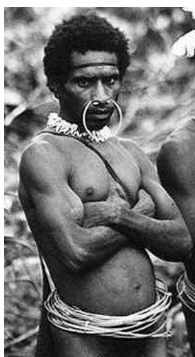
Som västpapuan för man räkna med hårda tag från polisens sida.

Jag tillbringade två månader på Västpapua, från början av mars till början på maj, så jag hann med att se en hel del och kan här så klart bara ge några spridda berättelser från resan. Jag besökte Jayapura, Wamena och Baliemdalen, Biak, Manokwari och Merauke samt en del mindre byar och samhällen.