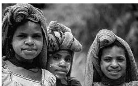
Barnen tittade nyfiket på de vita främlingarna

Detta var inte bara min första resa till Papua utan även min första resa utanför de nordiska länderna. Därför var det för mig rätt stora intryck redan på resan dit, vid t.ex. de stora flygplatserna i Amsterdam och Jakarta.