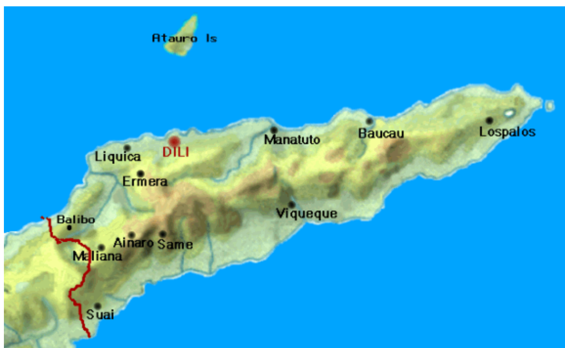
Topografisk karta över Östtimor. Enklaven Oecussi i Västtimor är inte med.

Kontakta oss också om Du vill att vi ska medverka med att tala om Östtimor på något möte på Din hemort. Vi kommer gärna och informerar om landet, de senaste händelserna och oss.