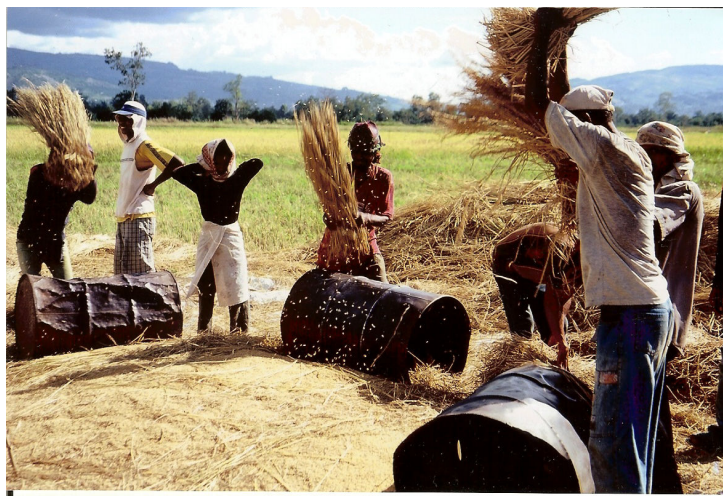
Skördearbete utanför Maliana i maj 2006