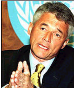
Sergio Vieira de Mello

Efterföljaren till UNTAET kommer att fokusera på den nya nationens säkerhet, menade de Mello. När Östtimor väl blir självständigt, kommer den inre säkerheten fortsätta att vara i fokus och det primära ansvarsområdet för CivPol, men givetvis med ökat inflytande av den inhemska polisen, ETPS. Samtidigt kommer den militära delen att minska i styrka med 44 %, ner till 5 000 mannan.