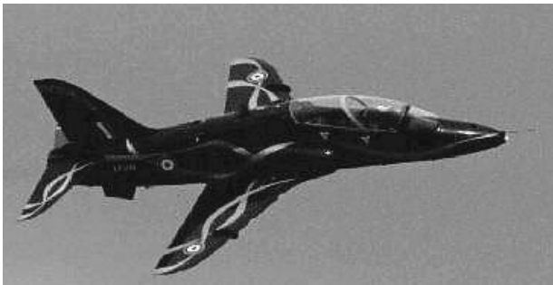
Brittiska stridsplanet Hawk

Estevao Cabral, Fretilins representant i Storbritannien, skriver om Indonesiens propagandakrig mot Östtimor. Detta började före invasionen 1975 i syfte att smutskasta Fretilin och att legitimera en invasion. Pressen var hårt censurerad under hela Östtimor-konflikten, varför de flesta indoneser var ovetande om den. Vissa indoneser presenterade sin egen version av läget i Östtimor i utländsk press. Några utlänningar - bl.a. Australiens f.d. premiärminister Gough Whitlam - förmåddes skriva artiklar som återspeglade den versionen. Cabral anger kommunistfobi som ett återkommande propagandatema och avslutar med att studera en artikel om Xanana Gus-