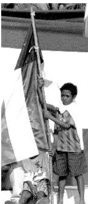
Pojke håller ÖT's flagga

Varje dag passeras nya artiklar genom den konstituerande församlingen. Bland annat stärks bandet till den portugisisktalande världen genom artikel nio, som stipulerar att "Östtimor skall fortsätta behålla sina starka band med de