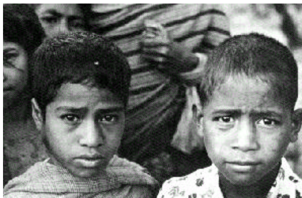
Två pojkar som får vänta några år på rätten att rösta